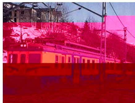
Un tren de la línia de Puigcerdà

Les parades d'autobusos seran, segons Renfe, al mateix lloc on hi ha les estacions, excepte ens els casos de Planoles i Alp. Al primer municipi els viatgers podran agafar l'autobús a la cruïlla de la N-260. A Alp, ho hauran de fer a l'Oficina d'Informació.